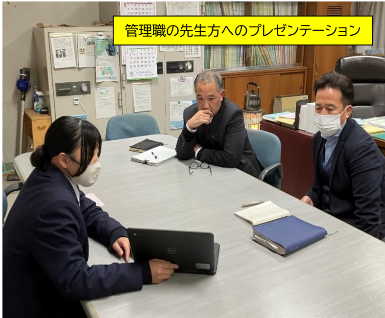
管理職の先生方へのプレゼンテーション